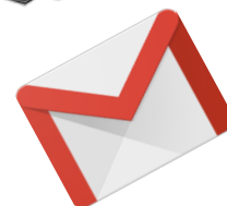
TRANSFERER (Tr: ou Fwd:)